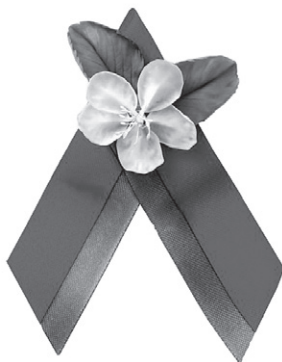
Рисунок 1 – «Цветы Великой Победы»

яблони (рисунок 1), по сути, заменила георгиевскую ленту. Исследователи полагают, что данный акт можно считать проявлением «изоляционистской меморализации»: если власти Украины в 2015 г. приняли западный символ (цветок мака), то в Беларуси был выбран новый, семантически нейтральный смысл, который одновременно дистанцируется и от российских, и от западных (ориентированных на жертв) нарративов (Fedor et al., 2017, p. 21).