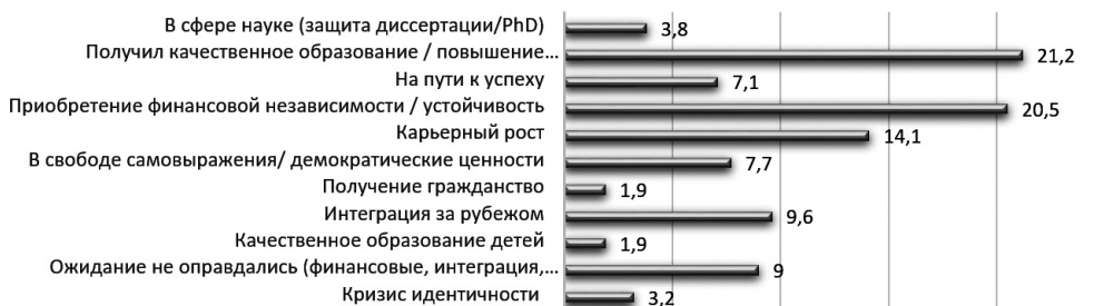
Диаграмма 1 – В чём достигли успеха в условиях миграции?

достигнуть успеха. Из опрошенных студентов 75 % считают, что они уже добились успеха, находятся на пути к успеху – 7,1 % (диаграмма 1).