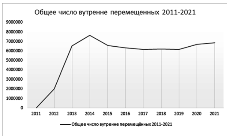
Рисунок 3 – Общее число внутренне перемещенных, 2011–2021 гг. (Refugee Data Finder, UNHCR. Retrieved July 10, 2023, from https://www.unhcr.org/refugee-statistics/download/?url=H38bK1 )

Figure 3 – Total number of internally displaced, 2011–2021 (Refugee Data Finder, UNHCR. Retrieved July 10, 2023, from https://www.unhcr.org/refugee-statistics/download/?url=H38bK1 )