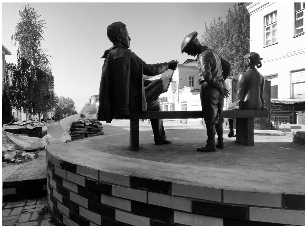
Рисунок 3 – Памятник художнику Н. Н. Жукову в Ельце в период реконструкции