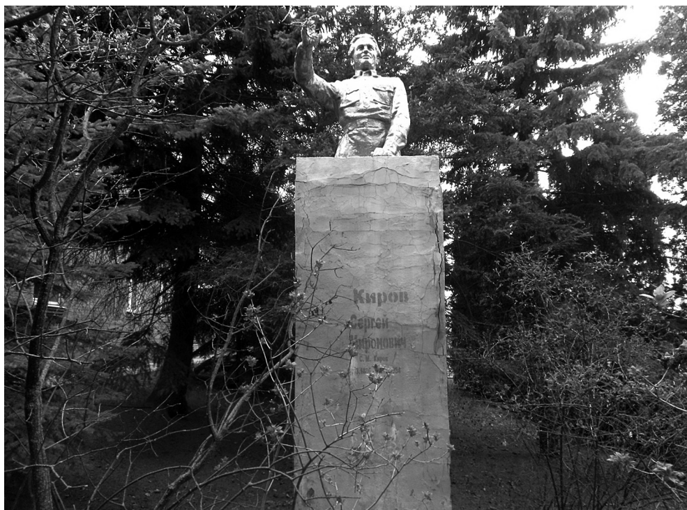
Рисунок 2 – Памятник С. М. Кирову в Ельце