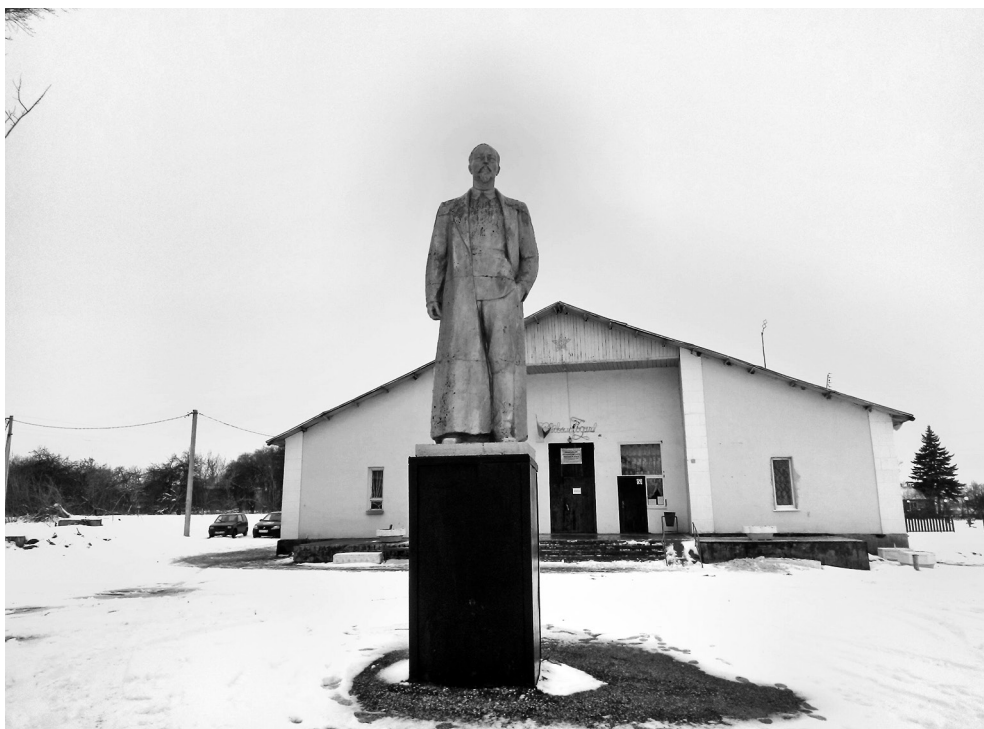
Рисунок 1 – Памятник Ф.Э. Дзержинскому, с. Афанасьево, Измалковский район Липецкой области