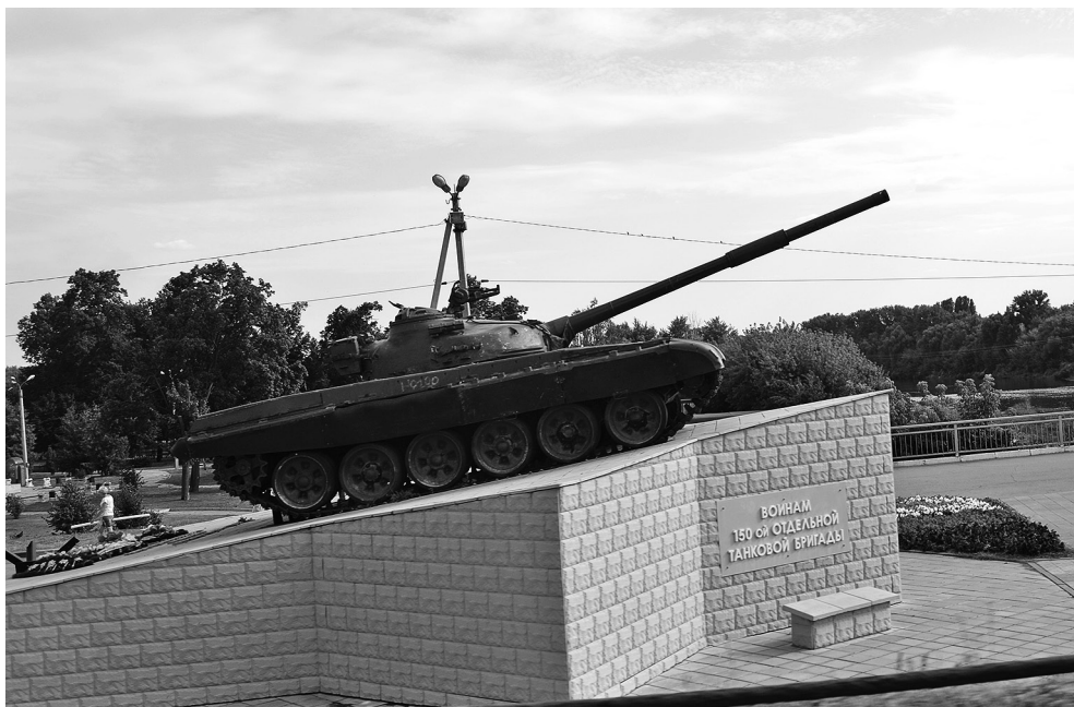
Рисунок 4 – Памятник танкистам, освобождавшим Елец в декабре 1941 г.

Приблизительность интерпретаций можно увидеть и на примере памятника танкистам 150-й отдельной танковой бригады (рис. 4), освобождавшей Елец в декабре 1941 г. Вопрос достоверности используемой в памятнике модели танка и его связи с событиями, к памяти которых должен отправлять монумент, безусловно, вызывает вопросы. Танк Т-72 заменяет танк Т-34, который в то время мог использоваться в освобождении города.