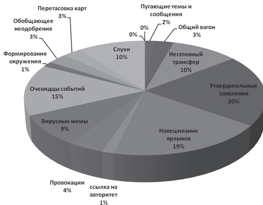
Рисунок 2 – Приемы информационной войны в украинских СМИ.

войны между Украиной и Россией. http://24tv.ua (дата обращения: 06.11.2015).