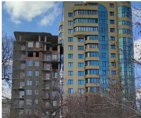
Рис. 2. Неофициальный «Памятник уплотнительной застройке» на ул. Урицкого. Дом-недострой слева «уперся» прямо в балкон дома справа. Яркая иллюстрация эпохи неолиберальных «машин роста» 8

Как отметили эксперты, недовольство градостроительной политикой В. Ф. Городецкого привело в 2014 г. на выборах мэра к «протестному голосованию». В апреле 2014 г. мэром во многом неожиданно для себя стал представитель КПРФ А. Е. Локоть.