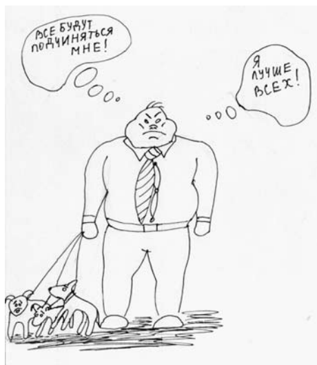
Рис. 1. Образ США. Рисуночная персонификация

В меньшей степени уделяется внимание отдельным странам Европы и Ближнего Востока, которые обычно рассматриваются как независимые