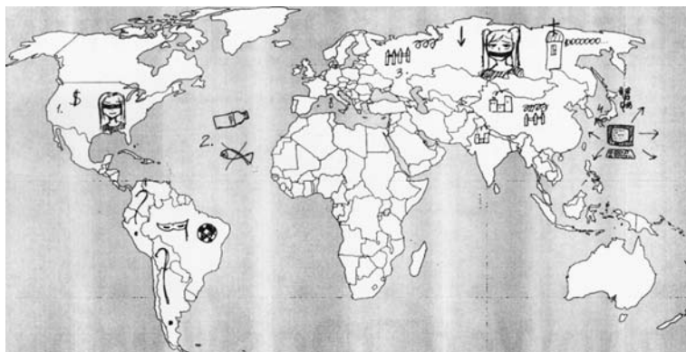
Рис.7. Образ карты мира. Тревожный тип политического восприятия

При анализе полученных результатов предложенные поговорки и пословицы были условно разделены на несколько тем, определивших фокус в восприятии международных отношений прошлого и современности. Были выделены: тема верности и предательства; тема защиты, поддержания мира и безопасности; тема идентификации (отношения мы и они , свой и чужой ); тема ресурсного потенциала, силы и влияния.