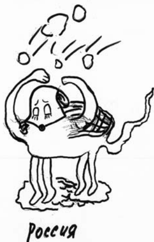
Рис.4. Образ России. Рисуночная персонификация

В ходе опроса от респондентов требовалось оценить современный международный порядок относительно 10 шкал, выбрав в каждом случае один из полюсов и определив в нем степень выраженности признака (от 1 до 3).