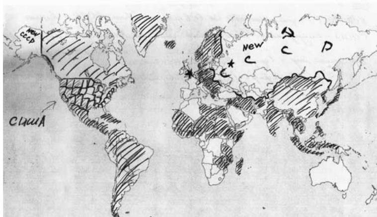
Рис. 5. Образ карты мира. Комментарий: двухполярный мир: Социалисты (Москва) – либеральный (Лондон). США – содружество независимых штатов Америки (после распада)

Пространственно-географические и исторические символы значительно актуализированы именно в оценках предполагаемых, желаемых или не желаемых изменений политической карты мира. В первую очередь здесь проявляют себя символы расширения и отделения. При обсуждении возможных изменений государственных границ внимание респондентов обычно уделяется проблематике геополитических, геоэкономических и культурных конфликтных взаимодействий. В качестве территории, которую стремятся присоединить к России, чаще всего выступает Аляска.