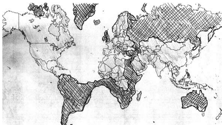
Рис. 6. Образ карты мира. Комментарий: Россия должна занимать большую территорию и окружать США для сдерживания их силы

стремились создать буферную зону безопасности или же использовать ее для нападения (рис. 6). Данная тенденция восприятия обусловлена как историческим и геополитическим факторами, так и чувством неуверенности в завтрашнем дне, тревогой на уровне индивидуального и массового сознания.