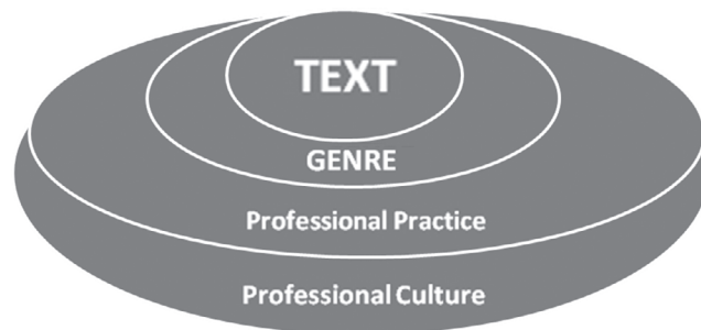
Схема 1 – Четыре уровня в реализации профессионального дискурса

дискурс. Параметры структурообразования профессионального дискурса подробно рассматривает В. Бхатия и выделяет в реализации профессионального дискурса такие четыре уровня, как текст, жанр, профессиональная практика и профессиональная культура [Bhatia, 2010] (см. схему 1).