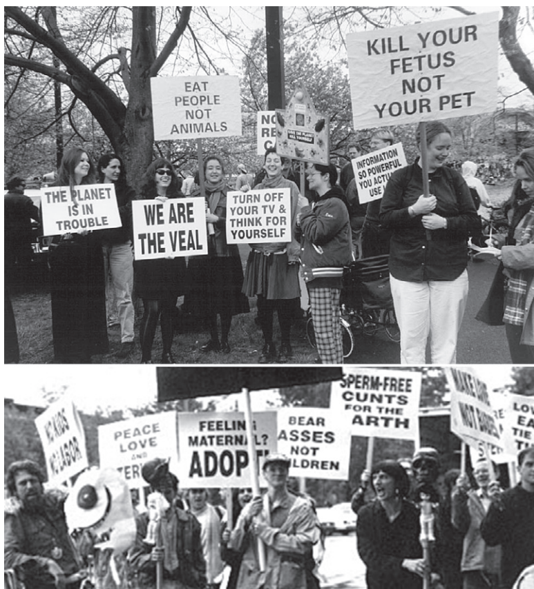
Рисунок 1 – Акции в пользу «добровольного вымирания»