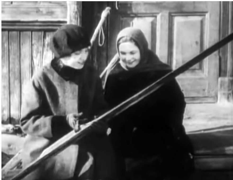
Рисунок 2 – Кадр из фильма «Проститутка», улыбающиеся лыжницы

героиня Любка, втянутая в проституцию (рис. 2). Именно катаясь на лыжах, она знакомится с человеком, который поможет ей выбраться из притона. Делая шаг к идеологически одобряемому досугу, она делает шаг к новой жизни.