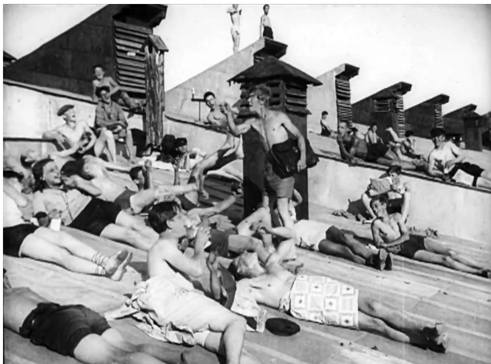
Рисунок 4 – Кадр из фильма «Парижский сапожник», солнечные ванны на крыше