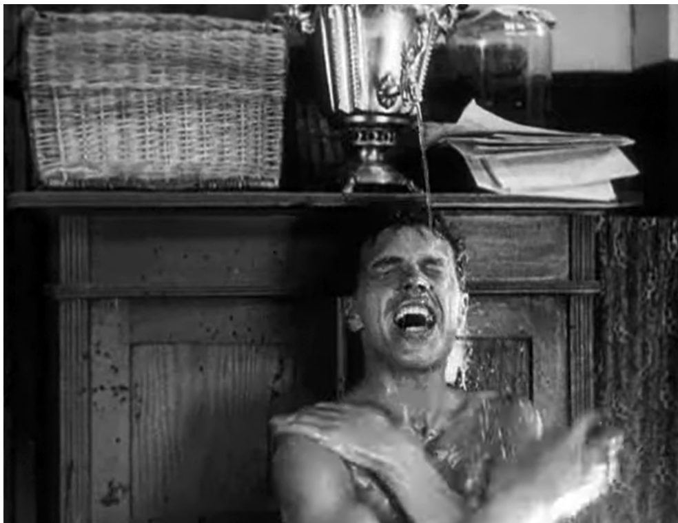
Рисунок 1 – Кадр из фильма «Третья Мещанская», Николай принимает утренний душ

В кино 1920-х гг. физкультура показана как привычная часть жизни молодежи. В «Третьей Мещанской» Николай утром обливается, делает гимнастику с гантелями, получая видимое удовольствие от процесса, а затем с некоторым самолюбованием осматривает себя – чувствуется режиссерская ирония по отношению к его занятиям физической культурой (рис. 1). Герой на работе бегаёт по стройке, но гордится своим телом в разговоре о любовных отношениях (интертитр: «Я не щуплый»), а не трудовых усилиях, тогда как, согласно большевистским идеологам, хорошая физическая форма необходима в первую очередь для эффективного труда.