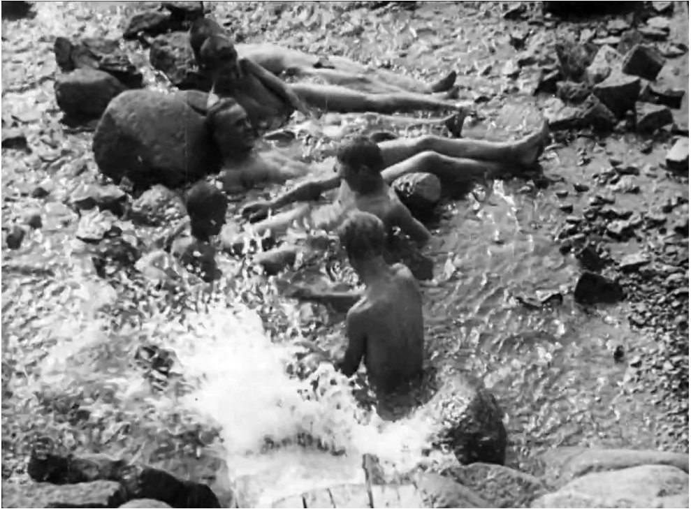
Рисунок 3 – Кадр из фильма «Парижский сапожник», отдых у воды