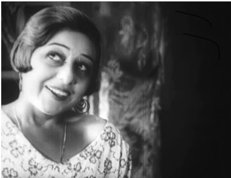
Рисунок 2 – Кадр из фильма «Катка – бумажный ранет». Верка мечтает о замужестве и собственном магазине (скриншот из архива авторов)

Figure 2 – A frame from the film “Katka’s Reinette Apples”. Verka dreams of marriage and her own shop (screenshot from the authors’ personal archive)