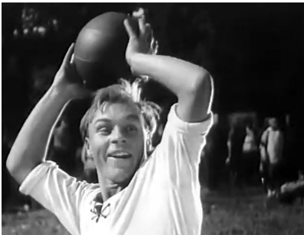
Рисунок 5 – Кадр из фильма «Кварталы предместья», игра в мяч (скриншот из архива автора)