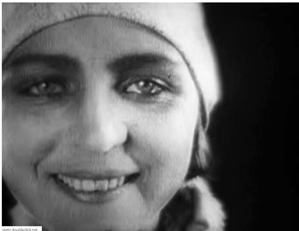
Рисунок 1 – Кадр из фильма «Катка – бумажный ранет». Катка поступила на завод