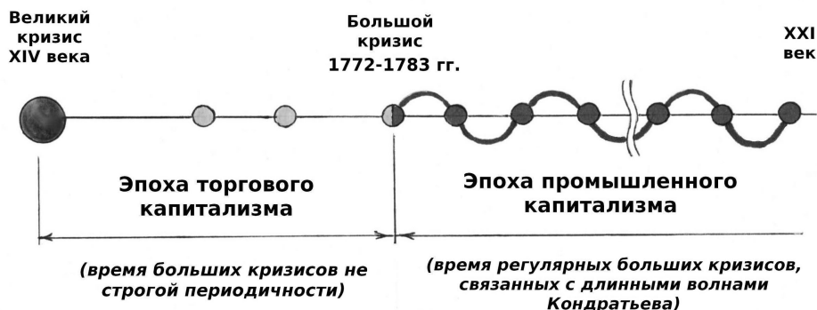
Рисунок 1 – Большие экономические кризисы до и после промышленного поворота 1770–1783 гг. (Колташов, 2019)