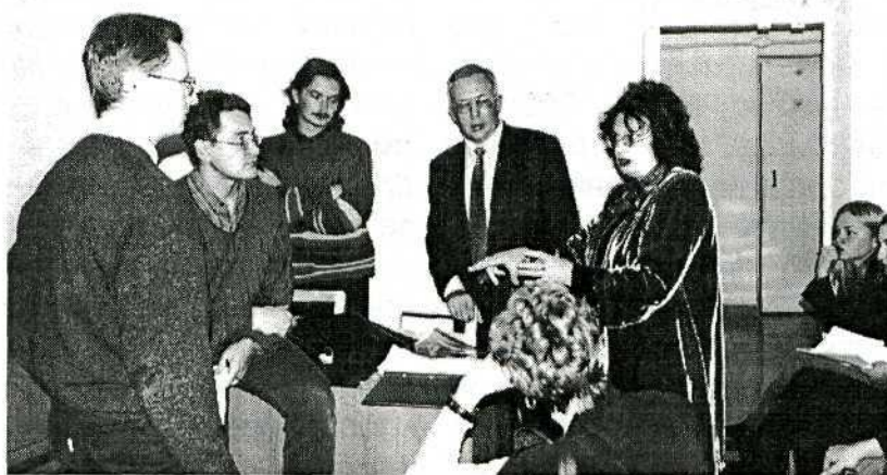
▲ В спорах о дискурсе...

С точки зрения исследователя ментальных парадигм эта ситуация сближает современное российское общество с традиционным. Однако это означает, что на деле в нашем обществе происходит отнюдь не раскол и внутренняя дифференциация — о чем мы уже привыкли слышать из весьма многочисленных уст политиков и ученых — а напротив, процессы сближения ранее удаленных социальных групп (по крайней мере, в каких-то весьма существенных отношениях)! Как объяснить этот парадокс? Что же на самом деле происходит с нашей социальной структурой? Фактически сегодня мы можем лишь обозначить эту проблему и предположить, что ее решение, возможно, даст нам ключ к более эффективным и менее затратным средствам влияния на аудиторию, нежели используемые сейчас механизмы, предназначенные для традиционного общества. Образно говоря, вопрос стоит так: можно ли вместо горчичников и чая с малиной для лечения острых респираторных заболеваний изобрести пенициллин? Однако даже для отрицательного ответа на этот вопрос нам придется вместо народной мудрости обратиться к научным методам исследования.